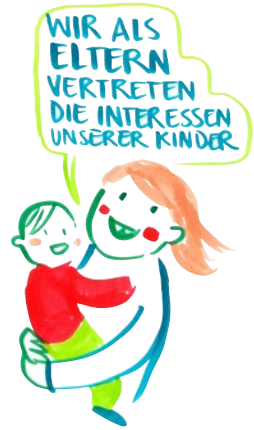
Artikel 3 UN-Kinderrechtskonvention

Eine partnerschaftliche und vertrauensvolle Zusammenarbeit ist das A und O für unsere Tätigkeit als Elternvertreter: