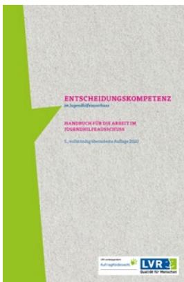
LVR-Broschüre „Entscheidungskompetenz im Jugendhilfeausschuss“