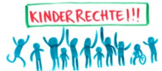
Artikel 12 UN-Kinderrechtskonvention